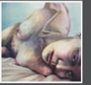
Guillermo Rivera Espejo